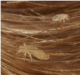
Imagen de piojos de verdad